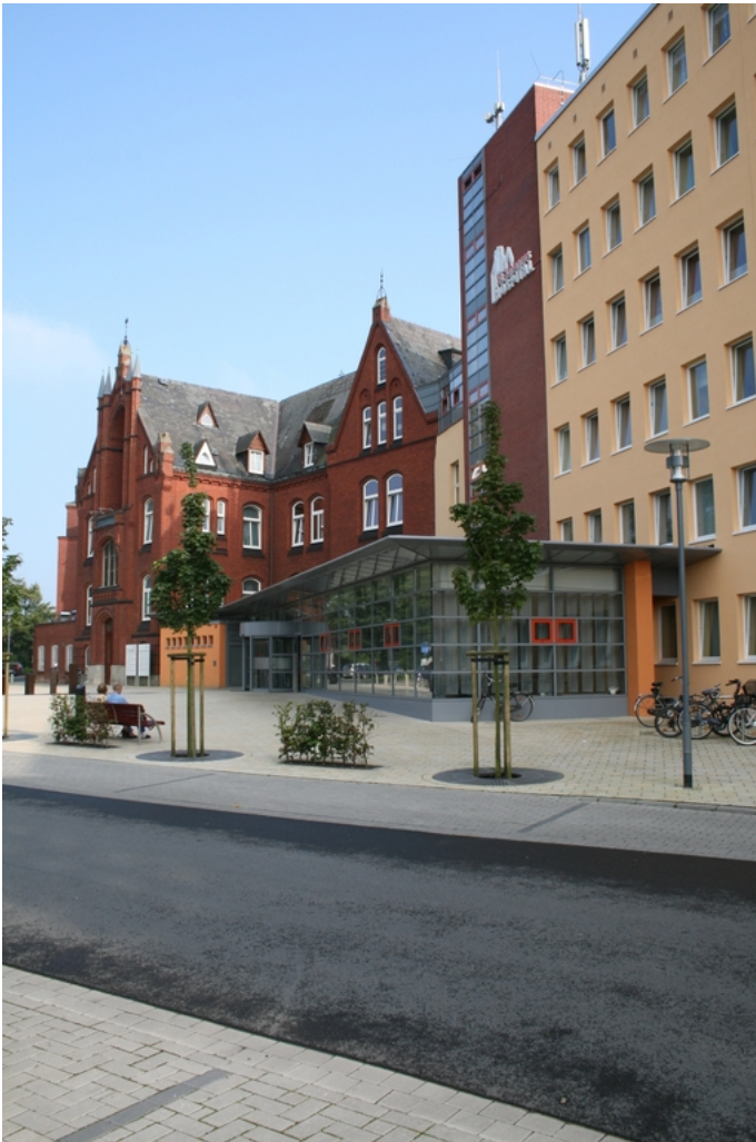
Abbildung: Ansicht mit Haupteingang

Mit unserem strukturierten Qualitätsbericht nach § 137 SGB V möchten wir das St. Johannes-Hospital mit seinen Fachabteilungen für 2010 präsentieren.